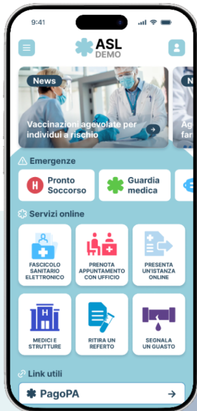
APP della tua ASL