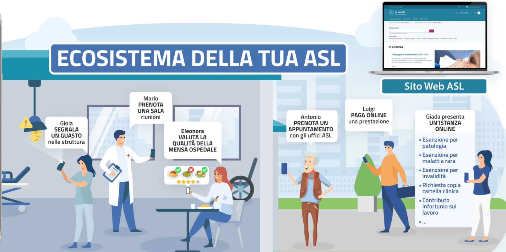
Personale nelle strutture ASL